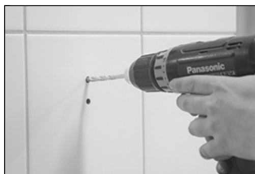
[ Billede 2.] 7 mm bor (anvend bor som er egnet til formålet) Kom vådrums silikone i hullet inden pluks presses ind.