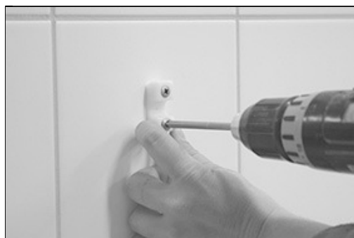
[Billede 5.] Emnet monteres med lempelig skruring,