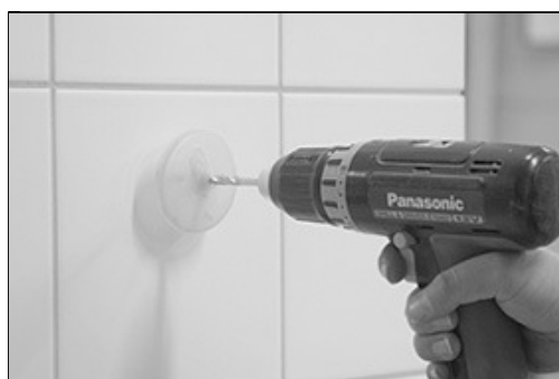
[ Billede 1.] Markere op emnets placering. (Bedst midt i en flise) Bore for gennem væggen materialer (Alle) med 5.5mm bor type Wedevåg hårdmetal

Fastgørelse af komponenter eller lign. til gulv kan kun ske med lim. (Ingen boring).