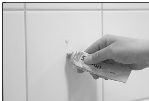
[Billede 4.] VIKTIGT! Kom vådrums silikone i pluksen og rundt om hullet.