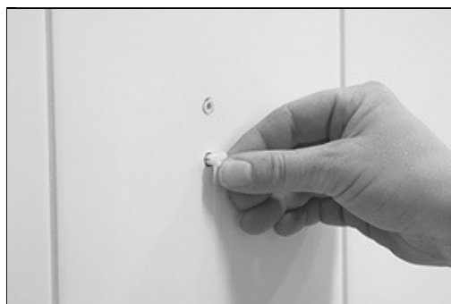
[Billede 3.] Montere plastpluks Pluks skal passe til 5.5mm hul.