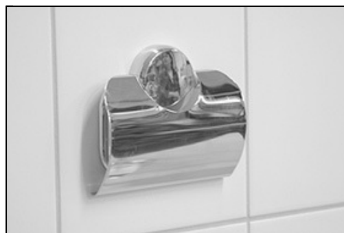
[Billede 6.] Emnet er monteret.